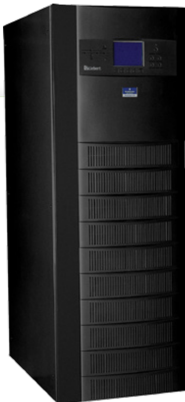
Liebert NXr UPS

La escalabilidad por sí sola no puede ayudarlo a lograr esta meta. Usted necesita una infraestructura que lo lleve un paso adelante. Una infraestructura que le ayude a adaptarse a sus necesidades.